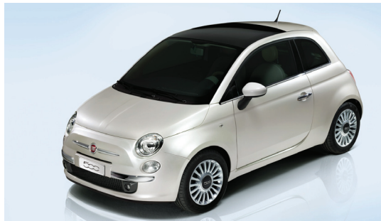
Aktueller Durchschnittspreis pro Modell in Prozent des ursprünglichen Listenpreises

Welche Automodelle schlagen sich bezüglich des Werterhalts am besten? Wir haben den aktuellen Preis von fünfjährigen Occasionen auf AutoScout24 mit dem historischen Listenpreis verglichen.